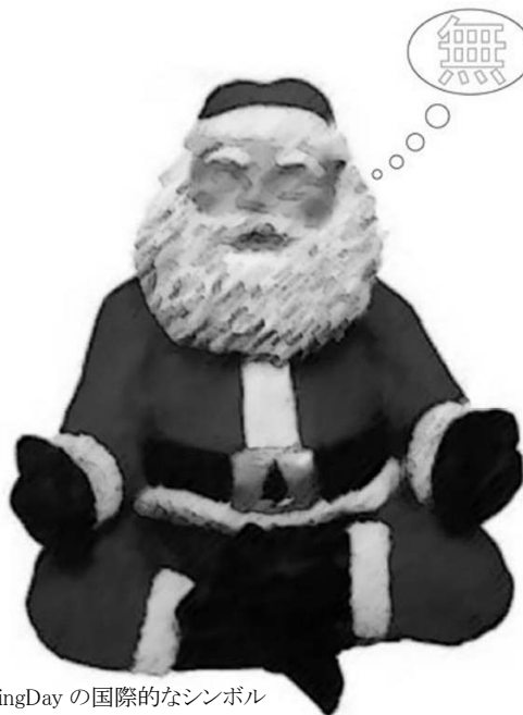
Buy NothingDay の国際的なシンボル 瞑想するサンタ=「禅タクロース」

そして、「消費社会」が、 あなたや、 子どもたちや、 地球環境に、 どんな影響を与えているか、 ちょっと、考えてみませんか？