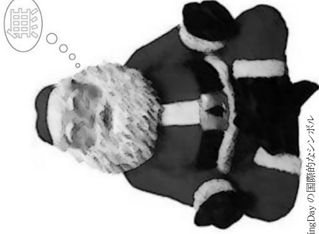
Buy Nothing Day の国際的なシンボル 瞑想するサンタ=「禅タクローズ」

そして、「消費社会」が、 あなたや、 子どもたちや、 地球環境に、 どんな影響を与えているか、 ちょっと、考えてみませんか？